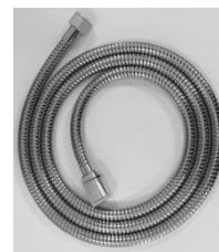
Ultraflex slange i kunststof med konus drejeled/antispind

Vare nr. 738032.104 1500 mm. Vare nr. 738035.104 2000 mm.