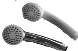
Power håndbruser krom / hvid

VVS nr. 738504.014 krom VVS nr. 738504.020 hvid