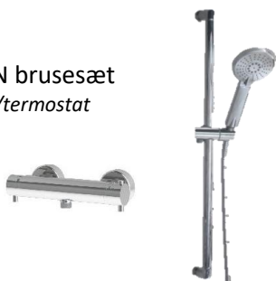
KN brusersæt m/termostat

VVS nr. 722920.804 krom VVS nr. 722920.817 stål look