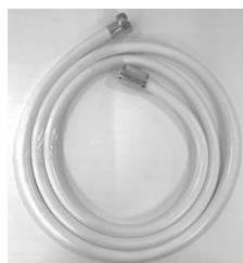
Classic hvid slange med konus drejeled/antispind

Vare nr. 738082.120 1500 mm. Vare nr. 738085.120 2000 mm. Vare nr. 738087.120 3000 mm.