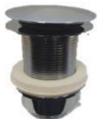
Bundventil "klik klak" Uden overløb