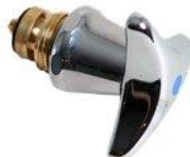
Ventiloverdel m/Tria greb 1/2"

VVS nr. 745013.511 blå VVS nr. 745013.512 rød