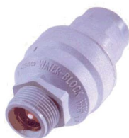
Waterblock / vandsikring

VVS nr. 747052.610 krom Vare nr. 0820-OT krom Vare nr. 0831-OT krom