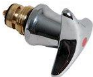
Ventiloverdel m/Tria greb 3/8"

VVS nr. 745011.511 blå VVS nr. 745011.512 rød