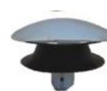
Bundprop "klik klak" For bidet, badekar & håndvask

VVS nr. 747052.610 krom Vare nr. 0820-OT krom Vare nr. 0831-OT krom