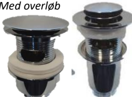
Bundventil "klik klak" Med overløb

VVS nr. 747052.110 krom VVS nr. 747052.140 stål look VVS nr. 747052.210 krom