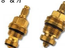
Spindel 3/8" & 1/2"

VVS nr. 745011.530 3/8" VVS nr. 745013.530 1/2"