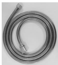
Forkromet rustfri slange med konus drejeled

Vare nr. 738002.106 1500 mm. Kan udtrækkes til 2000 mm. Vare nr. 738005.106 2000 mm. Kan udtrækkes til 2750 mm.