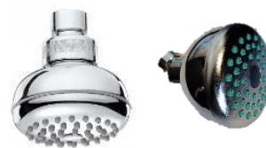
Hovedbruser m/kugleled - krom

Vare nr. I00070-030 Gommina Vare nr. 736095.004 Power